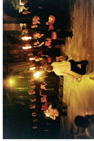
"Gennem ild og vand" Østerbro Brandstation, efterår 2001

Layout: Niels Erik Holm, 11. februar 2003