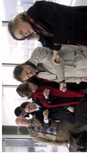
Roskilde Station, januar 2003