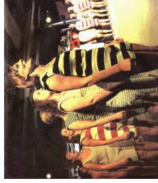
"Gennem ild og vand" Roskilde Beredskabsstation, efterår 2000

Med Østerbro Pumpestation som storslået kulisser vil vi tage publikum med på en kigger til en - måske - helt almindelig dag 'Under Uret'.