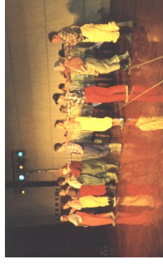
"Aqua" Fliværket Holhæk efteråret 1999