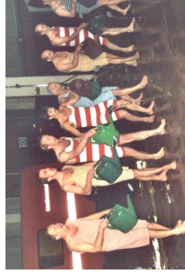
"Gennem ild og vand" Malmö Brandstation, efterår 2000