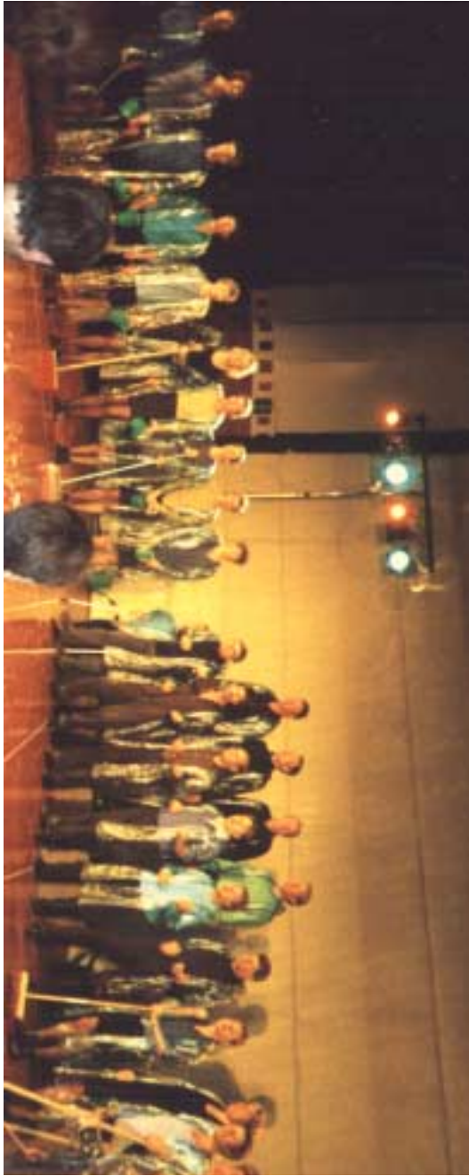
Opførsel af "Aqua - et regnstykke", Elværket, Holbæk efteråret 1999.